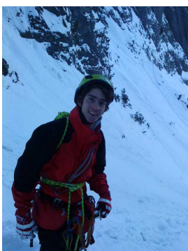
Patrasch beim Abstieg