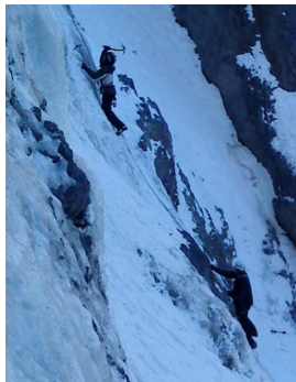
Kilian und Ruedi beim Aufstieg